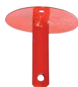
Pulversprinkler 2 kg och 6 kg