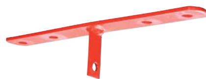
Pulversprinkler 12 kg